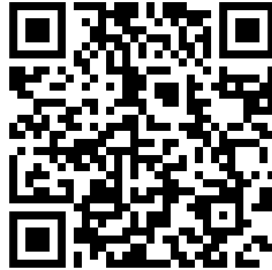
56-1 One Report

บริษัทได้จัดทำรายงานประจำปี 2568 (แบบ 56-1 One Report) ในรูปแบบอิเล็กทรอนิกส์โดยผู้ถือหุ้นสามารถสแกน QR Code ตามที่ปรากฏด้านล่าง เพื่อเข้าถึงรายงานประจำปี 2568 (แบบ 56-1 One Report) ของบริษัท